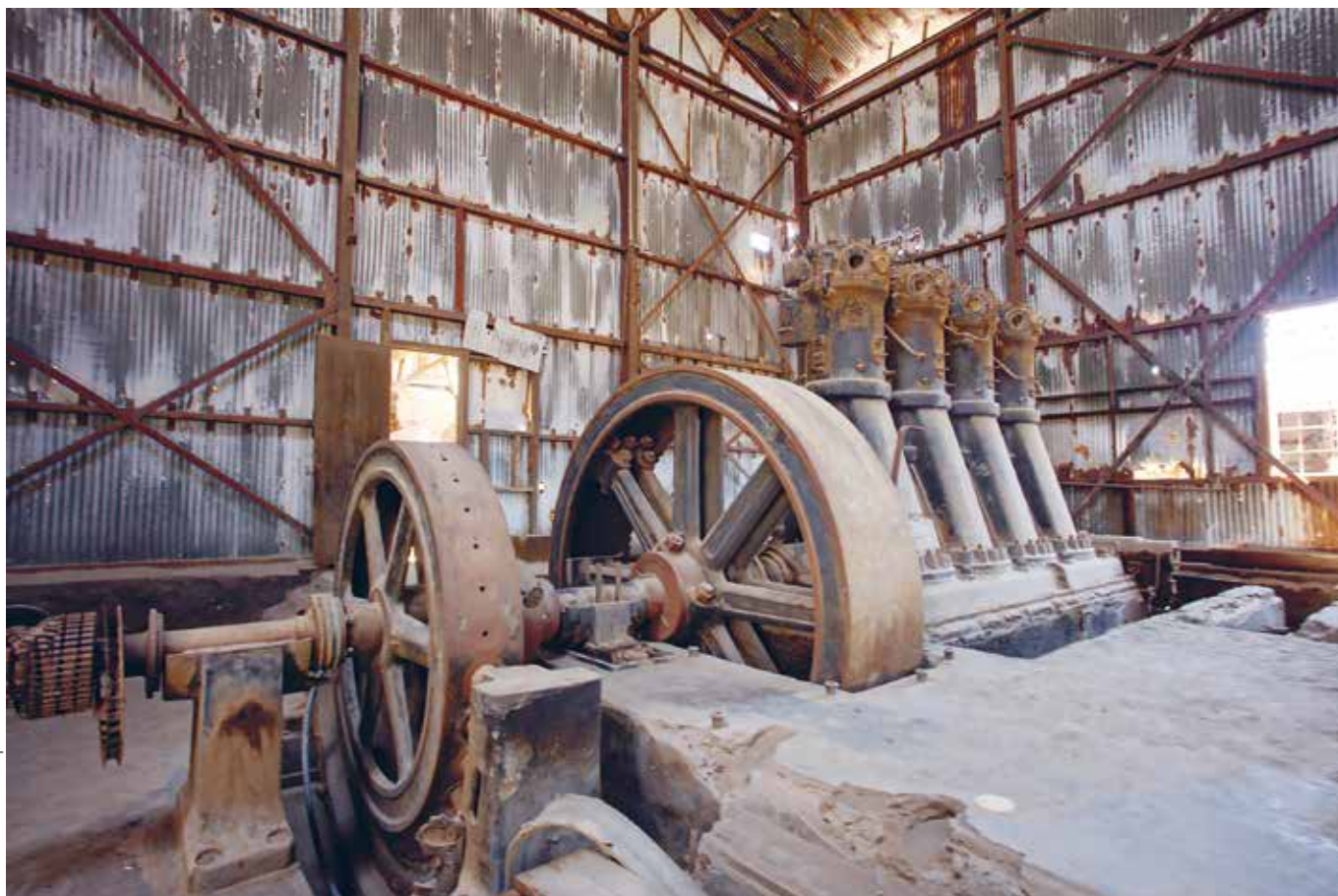
Matthew and Heather | Flickr CC BY-NC-ND 2.0